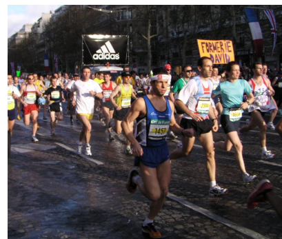
Paris marathon 2004